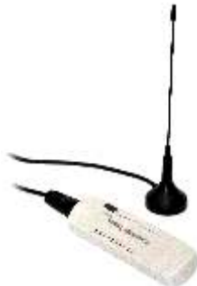
DVB-T-Antenne zum Anschluss an den Computer mittels USB-Stick