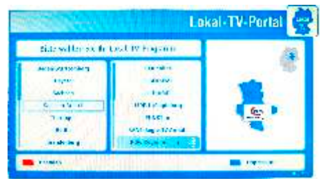
und des Fernsehsenders

Mit der Bestätigung durch die OK-Taste können Sie RAN1 sehen.