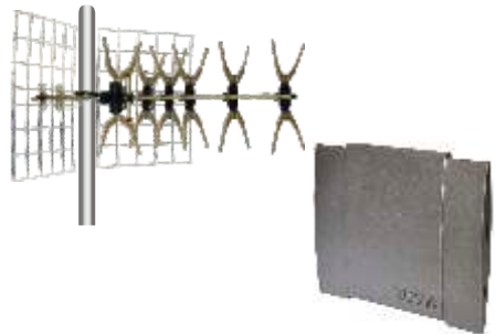
Außenantenne bei größerer Entfernung zum DVB-T - Sender