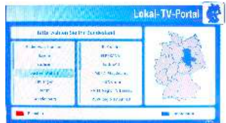
Auswählen des Bundeslandes ...

Wählen Sie zunächst das Bundesland Sachsen-Anhalt mit den Pfeiltasten Ihrer Fernbedienung oben/unten und dann mit der Pfeiltaste rechts die Senderauswahl. Aus den Sendern wählen Sie mit den Pfeiltasten oben/unten RAN1 .