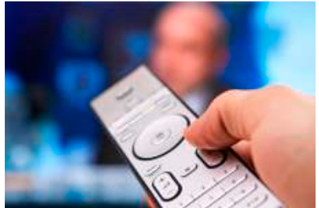
RAN1 sendet rund um die Uhr

RAN1 - Regionalfernsehen Anhalt sendet seit 1998 ein Vollprogramm. Wochentags (Mo-Fr) sind jeweils ab 18.00 Uhr in einem aktuellen Nachrichtenprogramm mit halbstündlicher Wiederholung Berichte, News, Reportagen, Tipps und vieles mehr aus der Region zu sehen.